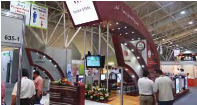
معرض البناء السعودي (١٦-١٩ أكتوبر ٢٠١١)

معرض البناء السعودي (١٦-١٩ أكتوبر ٢٠١١) وهو المعرض الدولي الثالث والعشرون لتكنولوجيا التشييد ومواد البناء. ولقد قدم المعرض مجموعة كاملة من حلول البناء إلى مقاولي العقارات وأصحاب المباني. ويعتبر معرض البناء السعودي من أكبر معارض أعمال البناء والإنشاءات في المملكة.