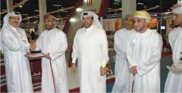
معرض عمان INFRAOMAN (٢٠-٢٢ سبتمبر ٢٠١١)

شاركت «قطر للصلب» في اثنين من المعارض في الخارج: